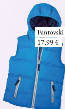
Fantovski brezrokavnik Vögele 17,99 €