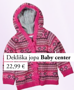
Dekliška jopa Baby center 22,99 €