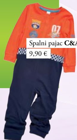
Spalni pajac C&A 9,90 €

Ko gre za spanje, je udobje še kako pomembno. Mehak in topel otroški spalni pajac bo poskrbel za brezskrben in miren spanec vašega sončka.