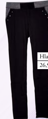
Hlače Lisa&Lu 26,90 €