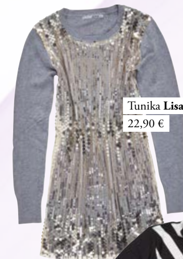
Tunika Lisa&Lu 22,90 €

Bleščice so dobrodošle na vsakem posebnem dogodku. Svetleč pulover čudovito poudari klasične črne hlače in salonarje, majhna torbica in sončna očala pa kombinaciji dodata glamur.