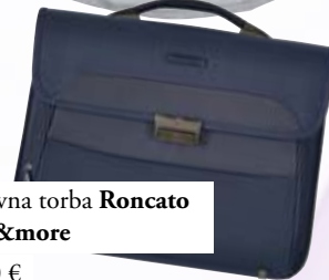
Poslovna torba Roncato Bags&more 95,90 €