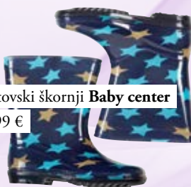
Fantovski škornji Baby center 12,99 €