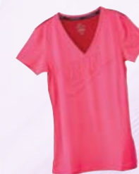
Top Nike Hervis 29,99 €

SUP izvira iz deskanja in ima svoje korenine na Havajih, kjer je deskanje že od nekdaj veliko več kot samo šport. Je kultura, tradicija, del vsakdanjega življenja in celo verskih običajev. Z uporabo vesla so deskarji izvajali treninge tehnike in stabilnosti ter si pomagali pri lovljenju ravnotežja na valu. Prvo tekmovanje s supanju so organizirali leta 2007 na jezeru Tahoe v severni Kaliforniji, kjer so se tekmovalci pomerili na desetkilometrski progi.