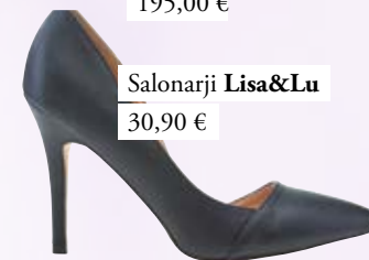
Salonarji Lisa&Lu 30,90 €