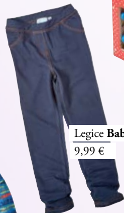
Legice Baby center 9,99 €