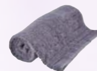
Brisača Interspar 11,99 €