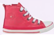
Dekliška obutev C&A 15,00 €