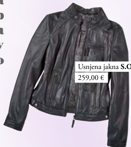
Usnjena jakna S.Oliver 259,00 €