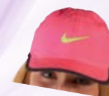
Kapa Nike Hervis 14,99 €