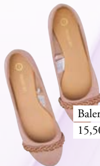
Balerinke C&A 15,50 €