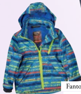
Fantovska softshell jakna Baby center 39,99 €