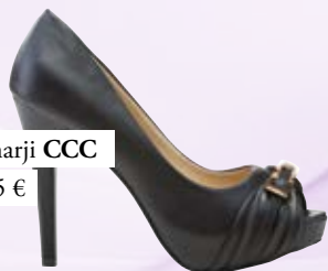
Salonarji CCC 24,95 €