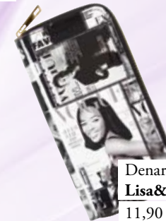
Denarnica Lisa&Lu 11,90 €