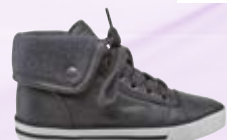
Fantovski gležnjariji C&A 19,00 €