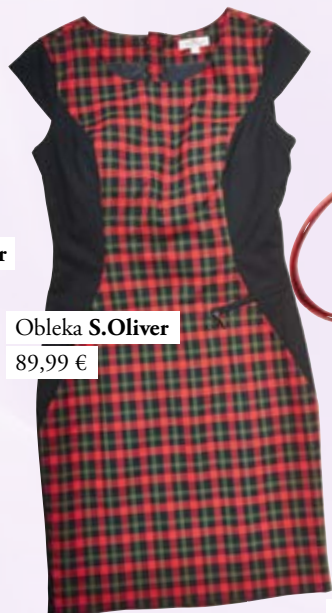
Obleka S.Oliver 89,99 €