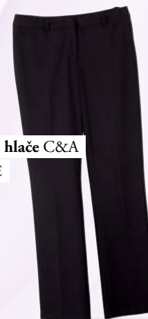
Ženske hlače C&A 29,00 €