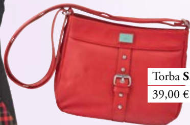
Torba S.Oliver 39,00 €