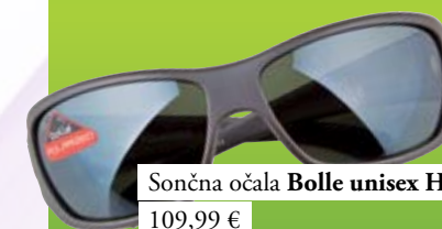
Sončna očala Bolle unisex Hervis 109,99 €

Bollé velja za enega izmed vodilnih svetovnih proizvajalcev športnih in sončnih očal. Namenjena so tako profesionalcem kot običajnim uporabnikom in izdelana po najnovejših tehnologijah na področju izdelave okvirjev in stekel za očala.