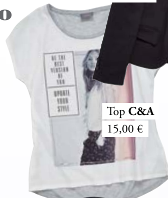
Top C&A 15,00 €