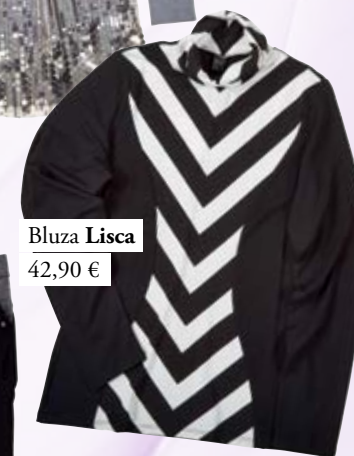
Bluza Lisca 42,90 €