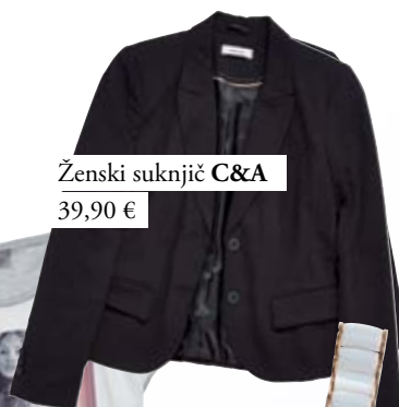
Ženski suknjič C&A 39,90 €

Za poslovno okolje je klasični hlačni kostim vedno prava izbira. Njegovo strogost omilimo s kombiniranjem s potiskano bombažno majico in zanimivimi balerinami v nežnih ženstvenih tonih.