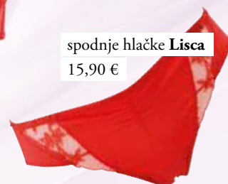
spodnje hlačke Lisca 15,90 €