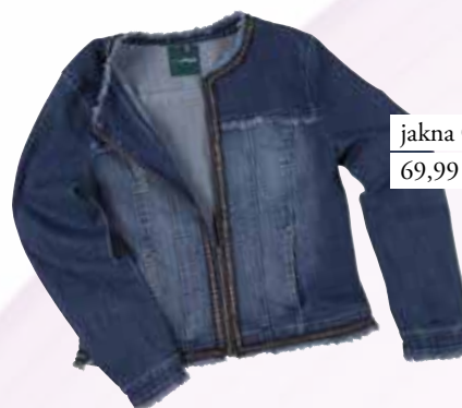
jakna Charles Vögele 69,99 €

Jakna iz džinsa z bleščečo obrobo je popolna izbira za spomladanski večerni izhod. Grafično kombinacijo s črtasto obleko in visokimi petami popestrite z majhno torbico in veliko značaja.