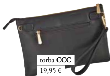
torba CCC 19,95 €