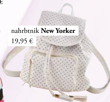
nahrbtnik New Yorker 19,95 €