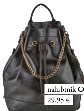
nahrbtnik CCC 29,95 €