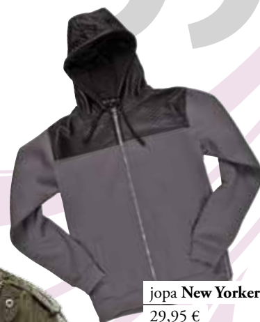
jopa New Yorker 29,95 €