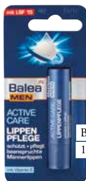
Balea balzam za ustnice za moške DM 1,39 €

Pred nanosom šminke je najbolje, da si ustnice namažemo z balzomom, ki bo ohranil svež pigment in hkrati ustnice zaščitil pred možnimi kemičnimi snovmi v šminki. Poleg tega bo poudaril polnost ustnic in preprečil nastanek grudic pri nanašanju šminke. Za letošnjo pomlad so najbolj aktualni odtenki šminke v barvah jagodičevja, ki pristajajo vsem generacijam dam. Ob nanašanju balzomov in šmink bodimo pozorne še na rok trajanja, saj lahko, kemikalije po preteku zelo agresivne in sprožijo marsikatero alergijsko reakcijo.