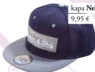
kapa New Yorker 9,95 €