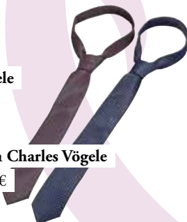
kravata Charles Vögele 12,99 €