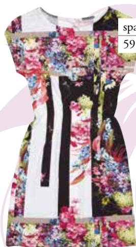
spalna srajca Liska 59,90 €