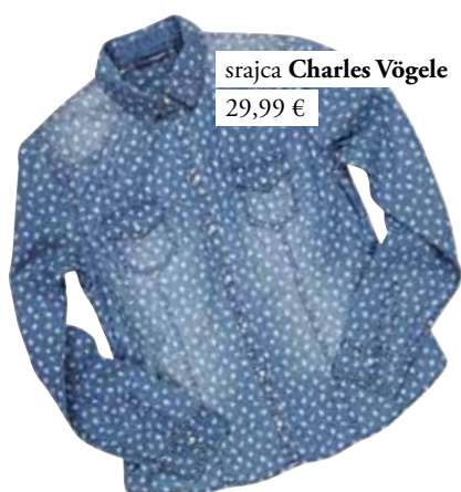
srajca Charles Vögele 29,99 €

Eden izmed najvidnejših letošnjih pomladnih trendov je vsekakor džins. V vseh odtenkih, potiskan, strgan, posut z bleščicami, kombiniran s supergami ali petami. Prav vsak lahko v Velenjki najde popoln kos zase in v pomlad zakoraka vstric s svetovnimi modnimi prestolnicami.