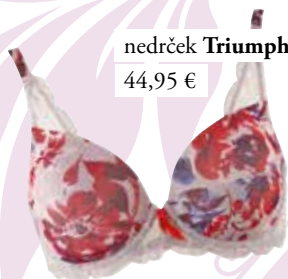
nedrček Triumph 44,95 €