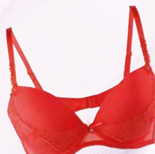
modrček Lisca 29,90 €