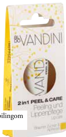
balzam za ustnice s pilingom Aldo Vandini DM 3,99 €