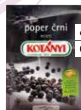
črni mleti poper Kotany Spar 0,70 €

Za odličen okus enolončnice poskrbi tudi malce olivnega olja, v katerem na hitro prepražimo česen, ravno toliko, da zadiši. S tem oljem pokapljajte krožnik, preden nadevate jed. Da bo enolončnica še okusnejša, jo lahko obogatimo tudi z žlico kisa, vina ali limoninega soka.