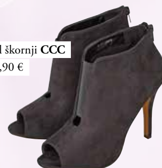
pol škornji CCC 19,90 €