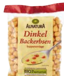
Jušne kroglice Alnatura DM 1,99 €