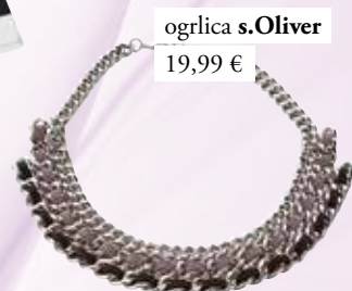
ogrlica s.Oliver 19,99 €