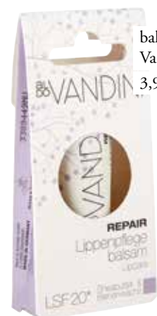
balzam za ustnice Aldo Vandini DM 3,99 €

Z nežnim pilingom s pomočjo zobne ščetke ali kristalov sladkorja enkrat tedensko poskrbimo, da so naše ustnice vedno videti popolno. Krožni gibi ščetke namreč odstranijo odmrle celice in hkrati poudarijo njihovo mehko.