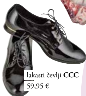
lakasti čevlji CCC 59,95 €