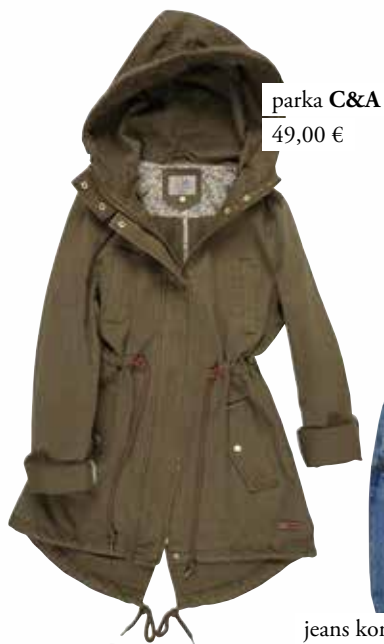
parka C&A 49,00 €

Spomladanski izlet bo še bolj nepozaben v kombinezonu iz džinsa, ki ga dopolnite s potiskano majico in sproščeno parko ter popestrite z neonskimi supergami.