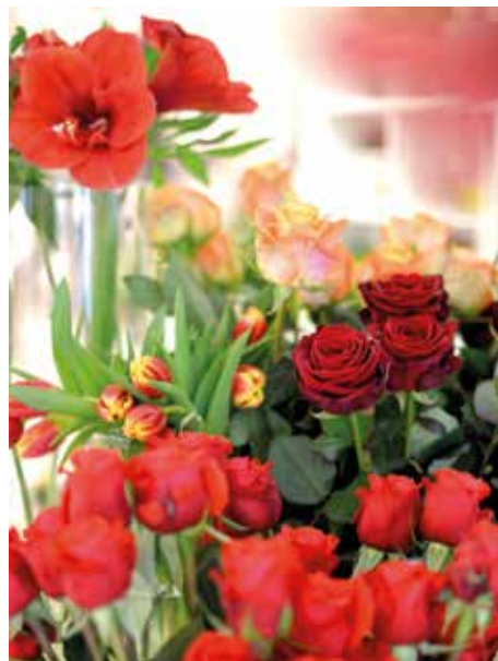
Rezano cvetje v odtenkih ljubezni. Cvetličarna Orhideja

Med sprehodom po Velenjki je možno opaziti čudovito izbiro lončnic in rezanega cvetja za vsak, še tako izbirčen okus. Glede na to, da so sobne rastline eden izmed večjih trendov notranjega oblikovanja, se lahko namesto šopka odločimo za nakup lončnice. Gospodične z manj vrtnarskega čuta bodo navdušene nad letos oh-tako-modnimi sončnicami, ljubiteljice zahtevnejših rastlin pa bodo vesele orhidej in amarilisov.