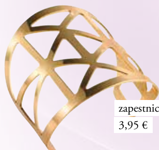
zapestnica New Yorker