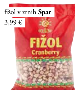
fižol v zrnih Spar 3,99 €