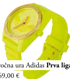
ročna ura Adidas Prva liga 69,00 €