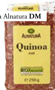
rdeča kvinoja Alnatura DM 3,49 €