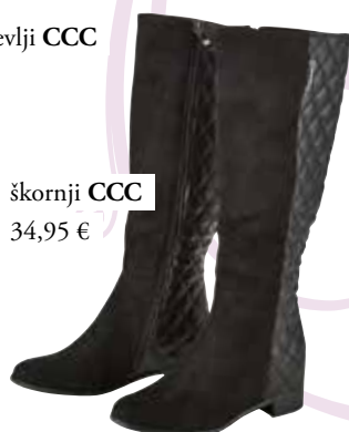
škornji CCC 34,95 €