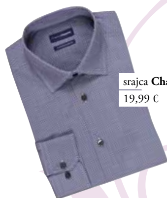
srajca Charles Vögele 19,99 €