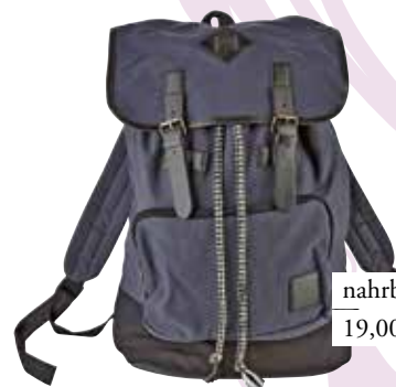
nahrbtnik C&A 19,00 €