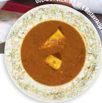
GOLAŽ S POLENTO 3,90 € Restavracija Rufa

Prednost enolončnic je v možnosti, da jih tudi čez dan ali dva enostavno pogrejemo in uživamo v pripravljenem obroku. To je še posebej praktično v današnjem hitrem tempu življenja, ko je vsak domač obrok zelo pomemben in koristen. Za enolončnice celo pravijo, da so naslednji dan še boljše – seveda pa jih moramo čez noč hraniti v hladilniku.