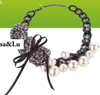
ogrlica Lisa&Lu 16,90 €

Poudarjene ogrlice so eden izmed trendov, ki bodo aktualni tudi spomladi. Čudovito se podajo k sproščeni kombinaciji oblačil in ji dodajo ekstravagantno noto. So popolna rešitev za vse zaposlene gospodične, ki želijo delavno garderobo po službi v trenutku spremeniti v večerno toaleto.