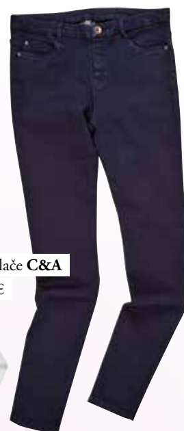
jeans hlače C&amp;A