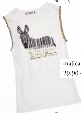
majica Lisa&Lu 29,90 €