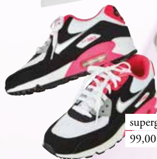
superge Nike Mass 99,00 €