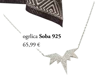
ogrlica Soba 925 65,99 €