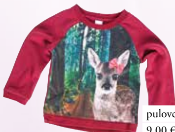
pulover C&A 9,00 €