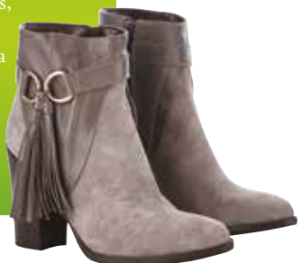
gležnjarji Mass 140,00 €

Dobri nizki škornji so tisti kos, brez katerega si je jesen res težko predstavljati. Če so nežno rjave barve in jim ob strani dinamično plapolajo še rese, so res popoln kos, ki se poda tako k kavbojkam kot krilcem. Široka, nekoliko robustna peta je odlična za dolgotrajno nošenje, kovinska zaponka pa poskrbi za eleganten odlesk.