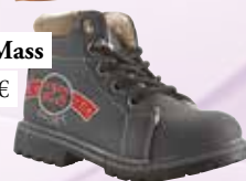
čevlji Mass 29,99 €