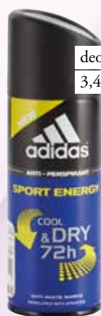
deodorant Adidas Prva Liga 3,45 €

*Ponudba velja na posebej označene modele od 27. 8. do 2. 9. 2015.