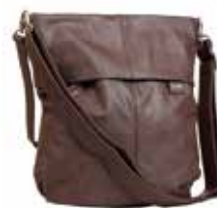
Zwei: 59,99 €