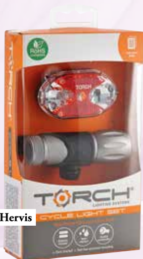
svetilka in odsevník Hervis 17,99 €