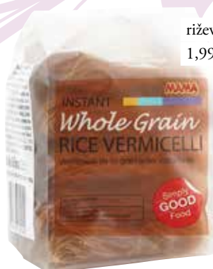
riževi rezanci DM 1,99 €