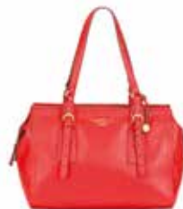
Fiorelli: 89,99 €