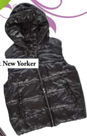
brezrokavnik New Yorker 29,95 €