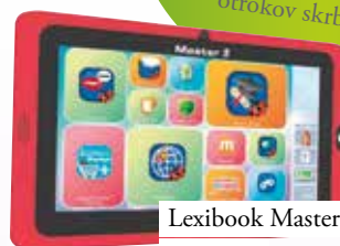
Lexibook Master 3 Baby Center 129,99 €

Nova in edinstvena tablica Lexibook Master 3 s pomočjo posebej prilagojenih vsebin v slovenskem jeziku vašega otroka zabava in poučuje na način, ki ga določite vi kot otrokov skrbnik.