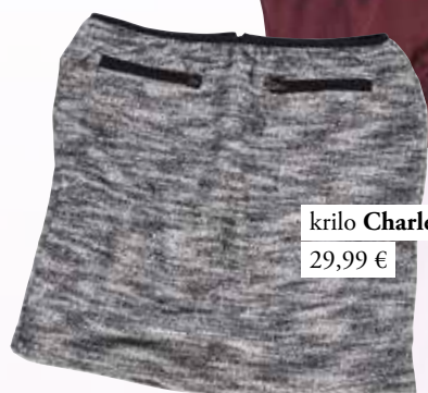
krilo Charles Voge