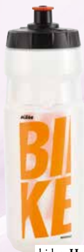
bidon Hervis 6,99 €