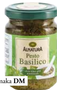
pesto omaka DM 2,39 €