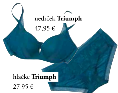
nedrček Triumph 47,95 €