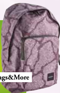
Nahrbtnik Reebok Bags&More 30,00 €

Novo šolsko leto kar kliče po izboru novega nahrbtnika. Izberimo takšnega, ki ga bo otrok poleg obiskov šole lahko uporabljal tudi za vikend izlete na deželo.