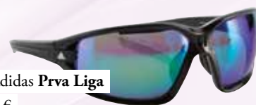
očala Adidas Prva Liga 179,00 €