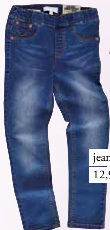
jeans hlače Charles Vogele 12,99 €