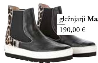
gležnjarji Mass 190,00 €