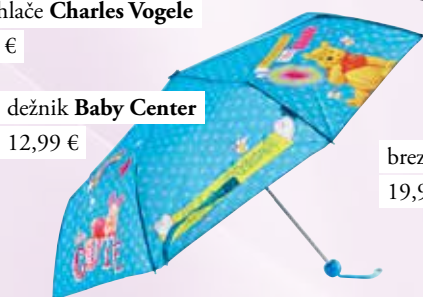
dežnik Baby Center 12,99 €