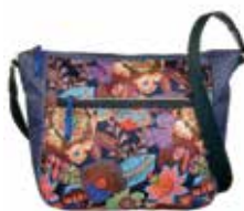
Oilily: 89,99 €

Trgovina Bags&More vas navdušuje z novimi kolekcijami za prihajajočo jesen in zimo. Izbirajte med odličnimi blagovnimi znamkami Picard, Fiorelli, Oilily, Gabol, David Jones, Zwei, Benetton, Sisley in mnogimi drugimi. Tudi za jesenska potepanja vas čaka pestra izbira potovalnih kovčkov Travel&More.