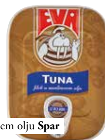
tuna v olivnem olju Spar 2,36 €