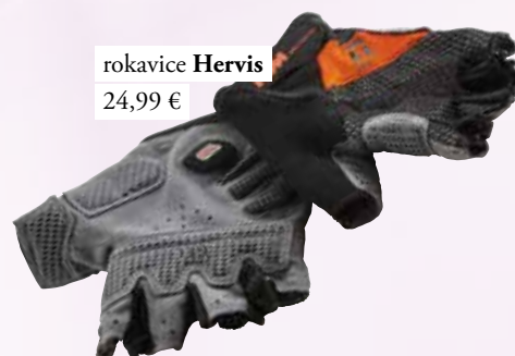
rokavice Hervis 24,99 €