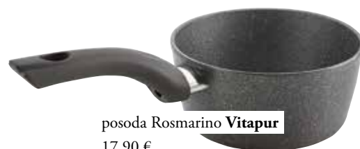
posoda Rosmarino Vitapur 17,90 €