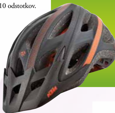
čelada očala Hervis 79,99 €

Na žalost nikoli ne vemo, kakšna nevarnost preži na nas na cestah in na kolesu smo še posebej ranljivi. Varnost na kolesu naj bo vedno prvotnega pomena, najbolj osnoven kos varnostne opreme pa je dobra čelada.