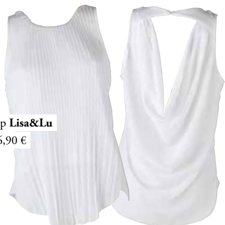
top Lisa&Lu 16,90 €