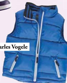
brezrokavnik Charles Vogele 19,99 €