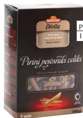
polnozrnat rezanci Spar 1,79 €