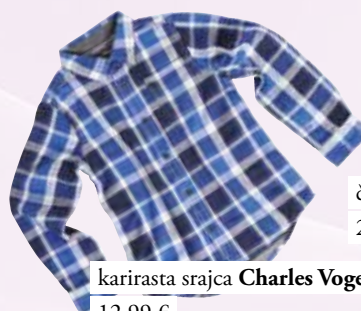
karirasta srajca Charles Vogele 12,99 €